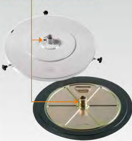
Boquilla grande \varnothing 45 mm